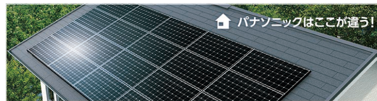
パナソニックはここが違う!

一貫生産による品質の高い製品をご家庭に。 パナソニックはインゴットからセル、モジュール、さらにパワーコンディショナなどのシステム機器まで自社製造する、世界でも貴重なメーカー。材料の品質も、製造・組み立てのノウハウも、すべて知りつくしてるので、あらゆる工程でクオリティを高められます。